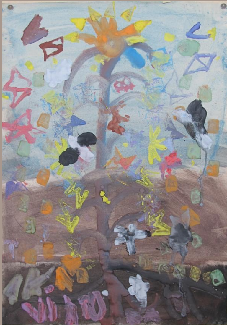
Viktoras. Pasaulio medis, 1 klasė

... suvaldyti neklusnią ranką, ... pažinti Lietuvos ar pasaulio kultūros paveldą.