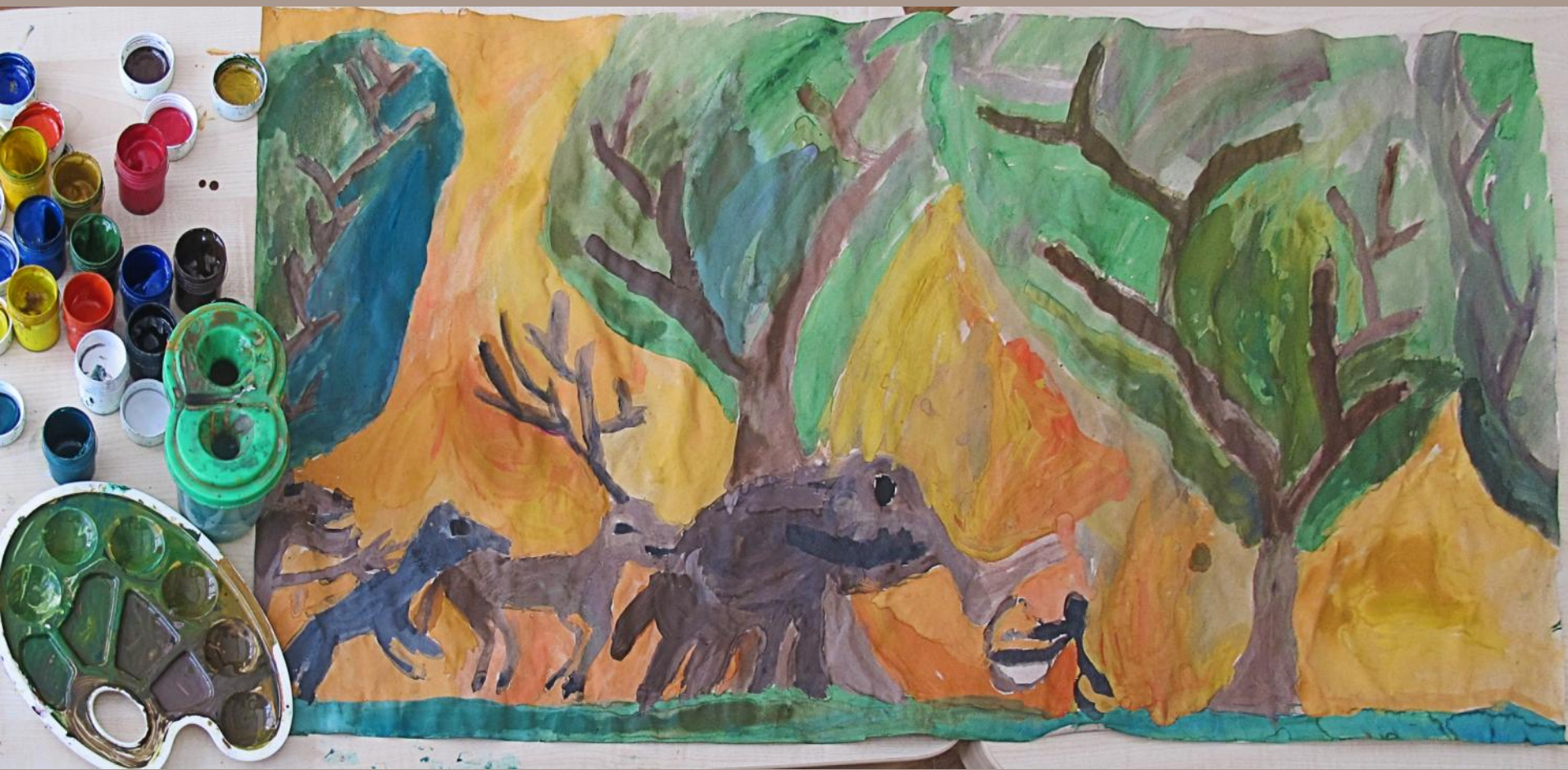
Lukas. M. K. Čiurlionio miškas – mano regėtas, 3 klasė