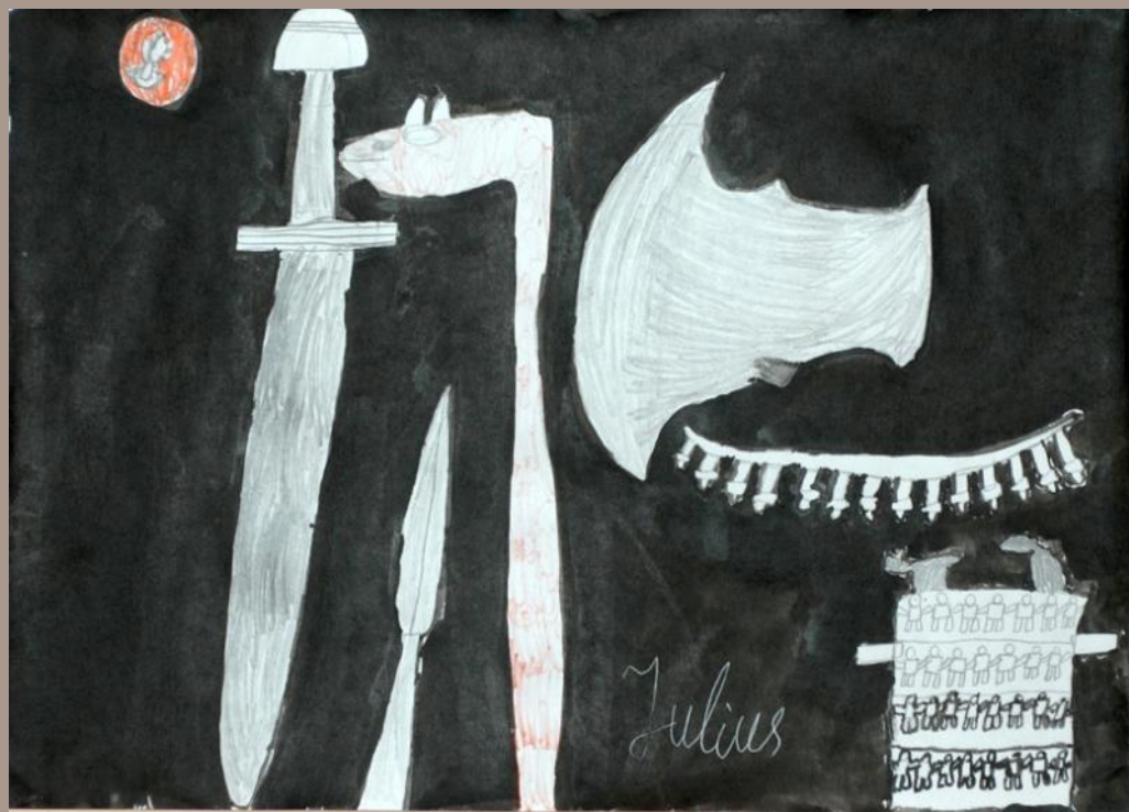
Julius. Lietuvos lobiai, 2 klasė