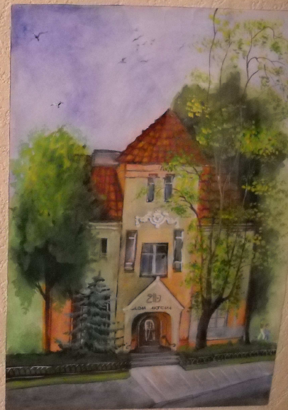
«Дом актора» Пронієва Дана