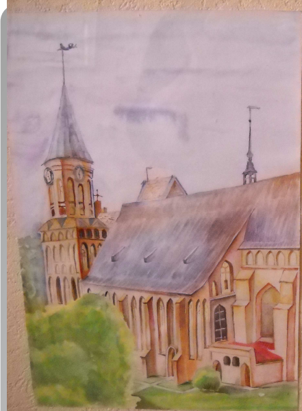
«Католицький собор» Васильєва Тана