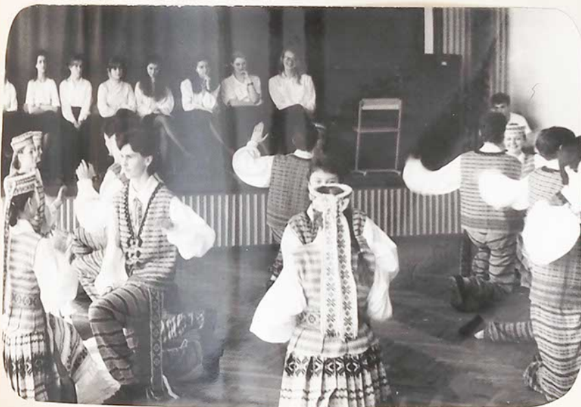
Šmagiai sukasi mūsų mokyklos tautinių šokių atlikėjai