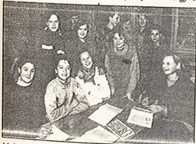
Linksmas, kada fizikos pamoką nutraukia nelaukti svečiai.