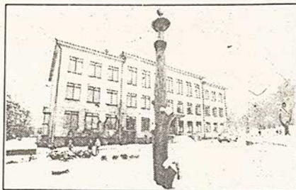
Į šiuos namus grįžta išdraskyta Lietuva.