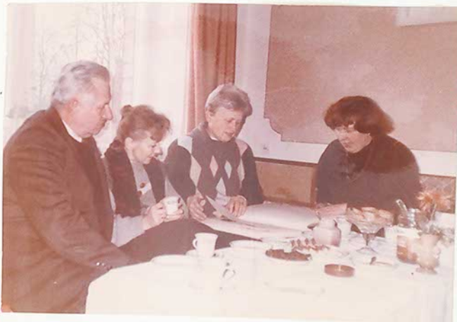
Svečiuose Vokietijos ambasados kultūros ir mokslo skyriaus darbuotoja. Susipažinimas su mokyklos metraščiu.