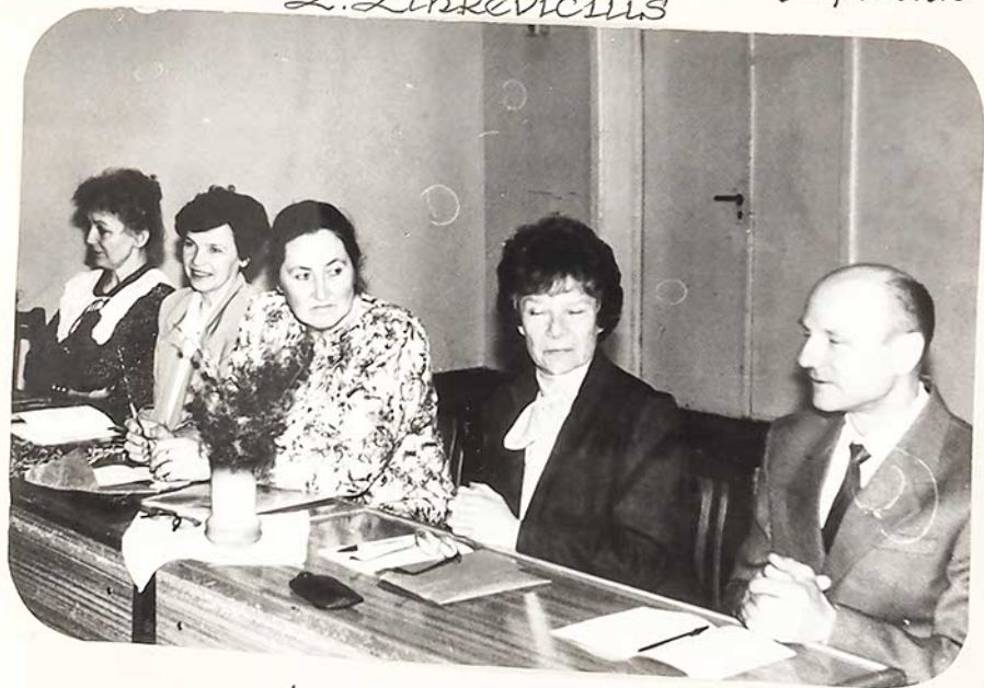
Šeiminkai ir svečiai