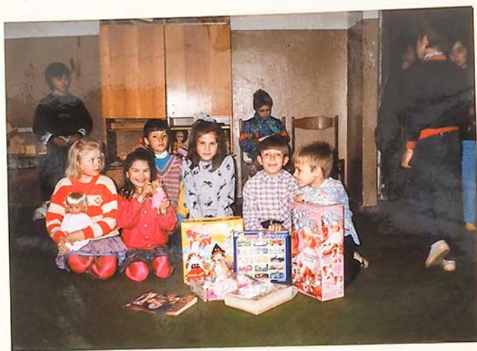
1-VI klasių mokiniai džiaugiasi Kanados lietuvių bendruomenės padovano- tais žaislais