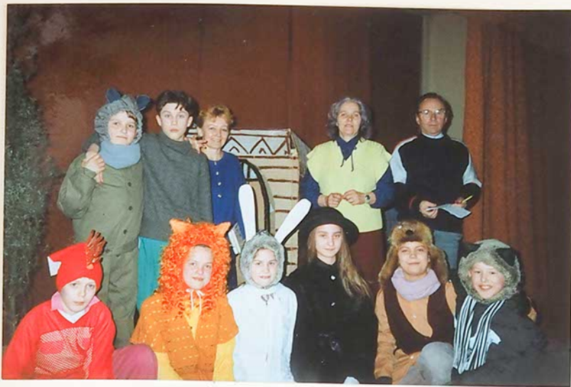
Penktokai su savo mokytojais po spektaklio