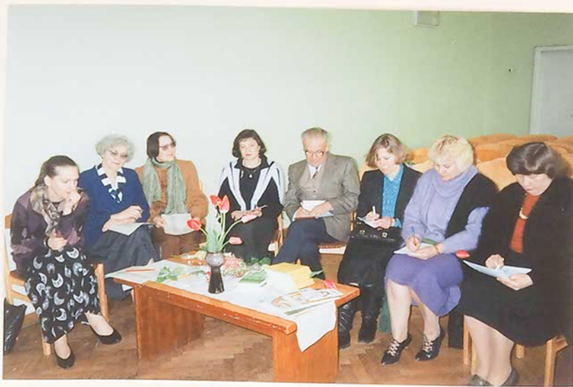
Skaitovų vertinimo komisija