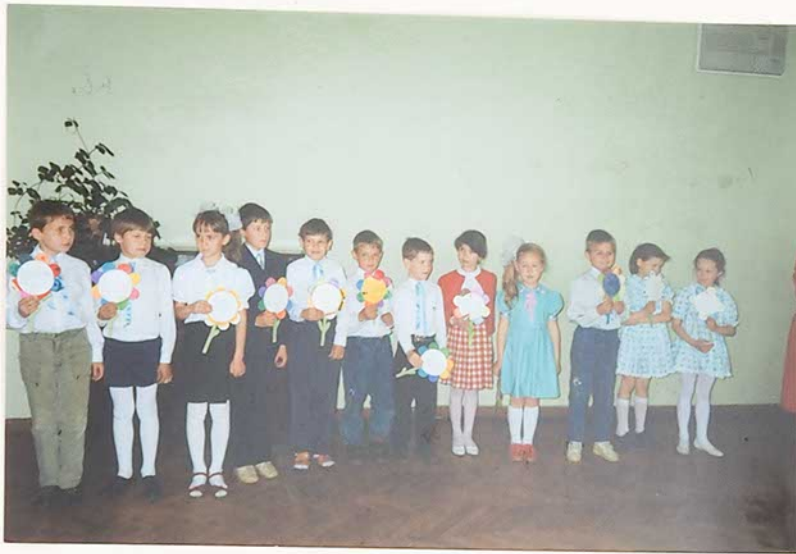
Mūsų dovanos Tau – Tėvyne!