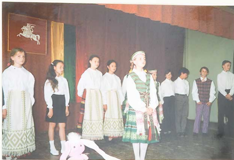
"Su vasaros pirmu dvelksmu Ištusteja mokyklos suolai!"