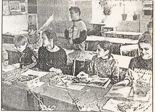
Piešimo pamoka: kaip nuspalvinti šį pavasarį?

- Mokysim, - atsakė direktorius. - Pasispausim, bendrabutyje apgyvendinsim ne po du, o po tris, atsijėm dabar