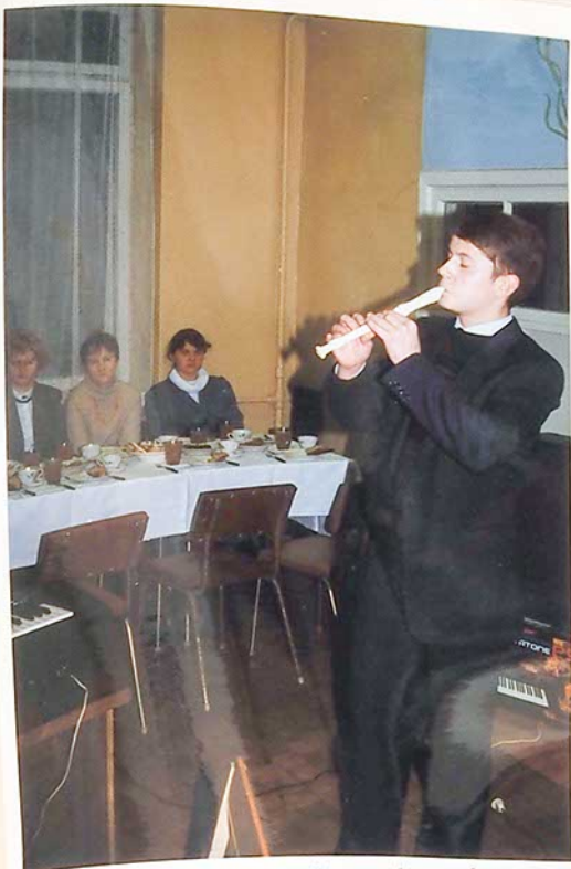
Kūčių vakarienė. Groja Vilniaus kunigų seminarijos studentas