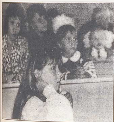
Moksleivius sveikina Lietuvos kariuomenės garbės sargybos orkestras.