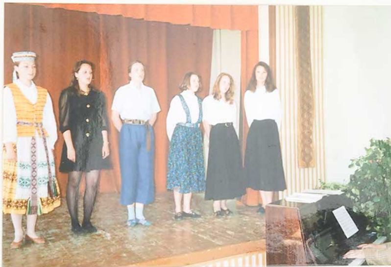
Dainuoja merginu vokalinis ansamblis