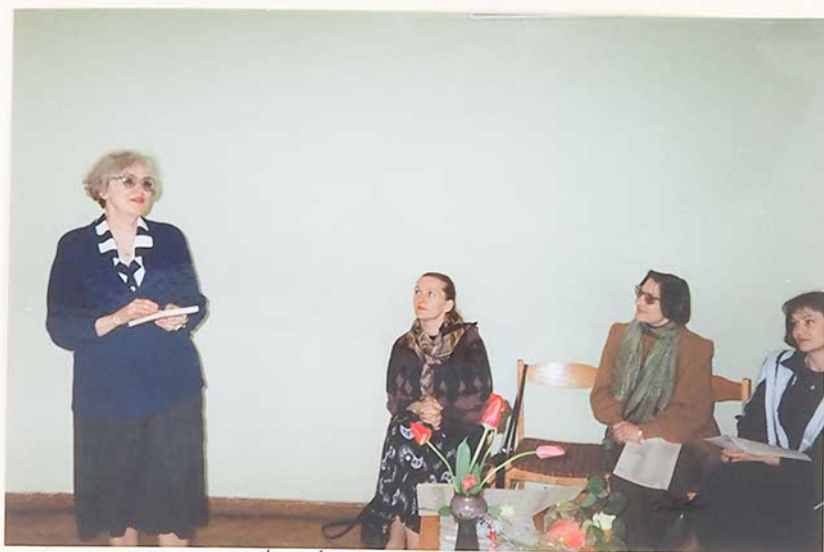
Kalba poetė Ramutė Skučaitė