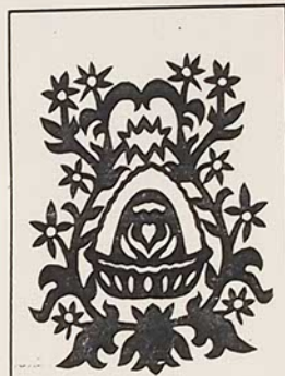
Elenutės Ragovskajos šventinis karpinys. 7 klasė.