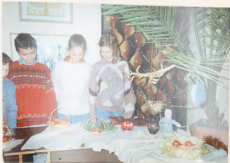
"Tu, margučiu gražumėlis," - stebisi vaikai