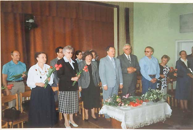
Paskutinio skambučio šventės akimirka