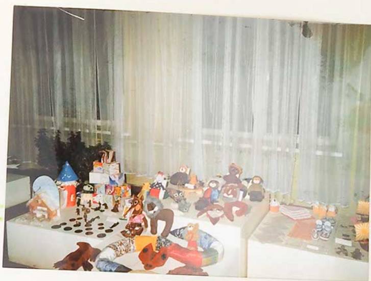
Parodos kambario bendras vaizdas