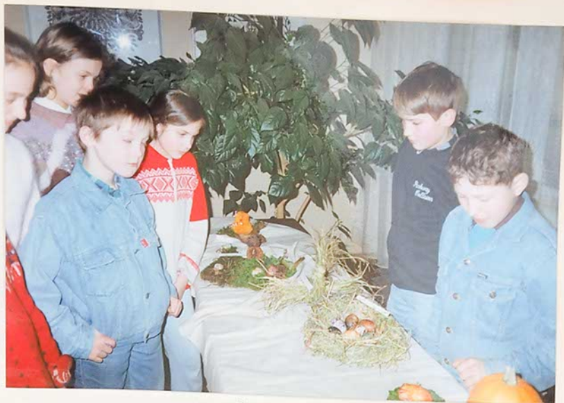
Velykų paroda apžiūri penktokai

"Europos lietuviai" 1995 balandžio 15-21 d.