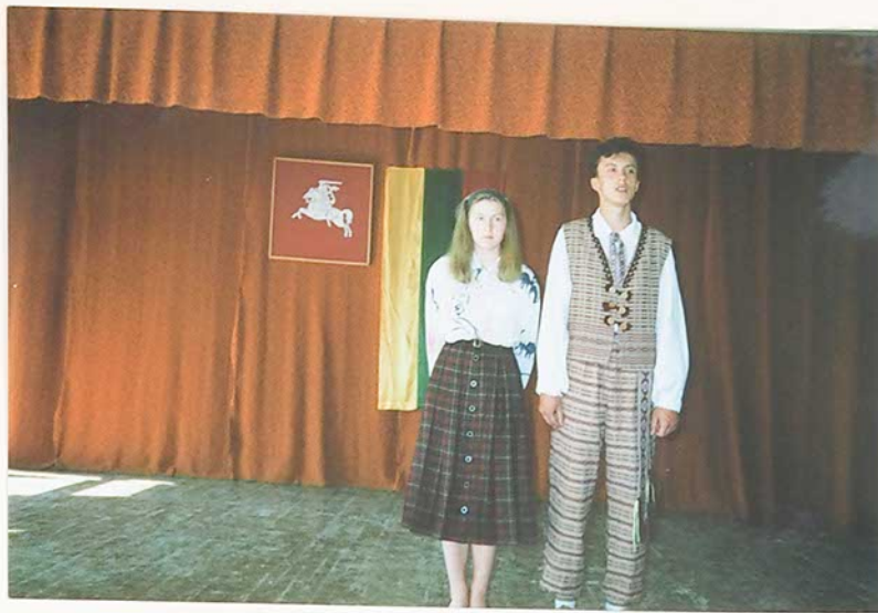
Aciu Tau, mokytojai!