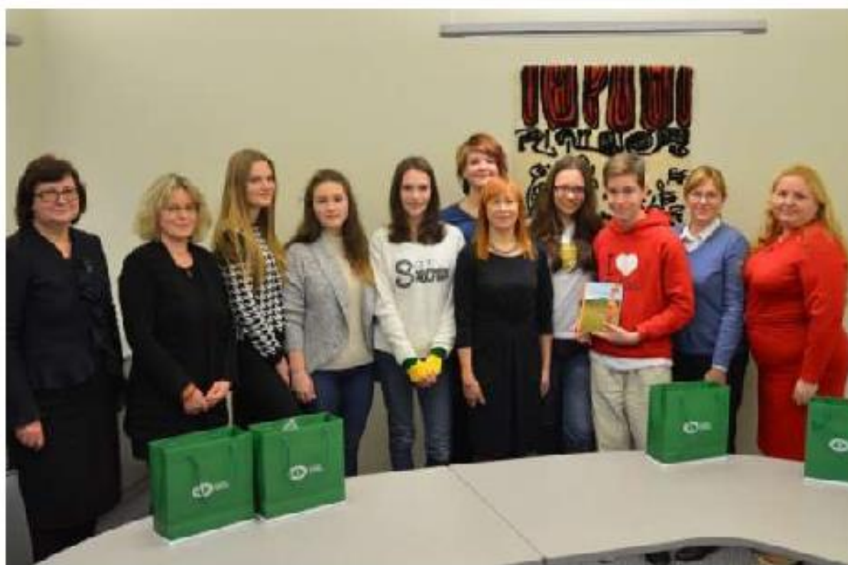
Susitikime su švietimo ir mokslo ministre Jurgita Petrauskiene.

Dalyviams buvo suteikta galimybė bendrauti neformalioje aplinkoje su Lietuvių namų bendrabutyje pasilikusiais vaikais ir, tokiu būdu, dar labiau pagilinti lietuvių kalbos bendravimo įgūdžius.