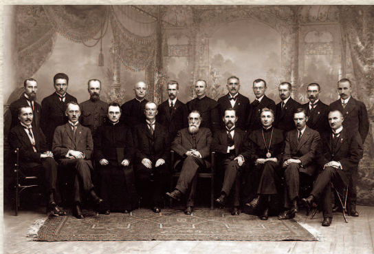
Lietuvos Nepriklausomybės Akto signatarai. Jonas Smilgevičius pirmas iš dešinės (sėdi)

1942 m. rugsėjo 27 d., eidamas 73-uosius metus, Jonas Smilgevičius mirė Kaune. Palaidotas Užventčio dvaro koplyčioje. 1998 m. palaikai perlaidoti Užventčio miestelio kapinėse.