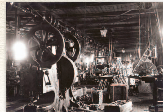
Vilijos gamykla Vilniuje